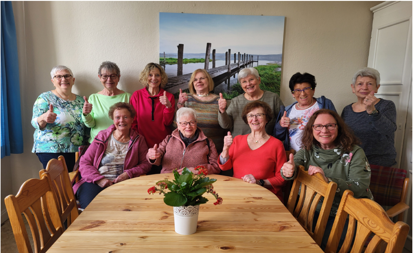
Auch die Freitags-Spinning-Gruppe freut sich über den aufgearbeiteten Tisch oben in der Küche. Vielen Dank an den Förderverein!