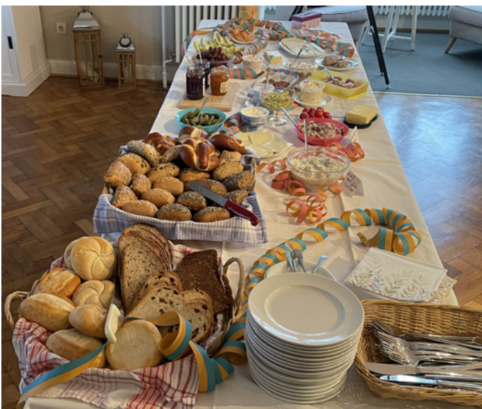
Die reich gedeckte Tafel des Mitbringfrühstücks am 13.02.2026